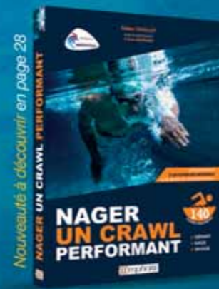
Nouveauté à découvrir en page 28