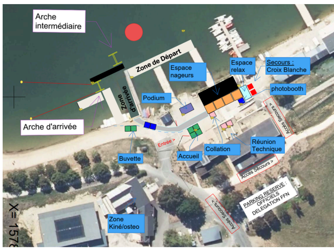
Plan indicatif - sous réserve de changements