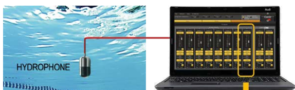
Mesure de référence de l'acoustique du bassin