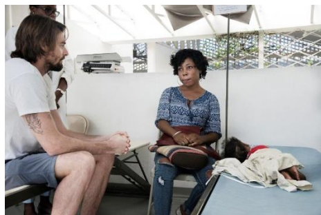
Mission UNICEF/ FFN / Camille Lacourt (parrain Nuit de l'Eau) Haïti.

« Ce qui marque le plus ce sont les conditions de vie des enfants ! On n'a pas envie de les voir travailler ou marcher pour aller chercher de l'eau, c'est extrêmement choquant. Un enfant doit aller à l'école et rester loin des problèmes sanitaires. En Haïti, ils n'ont pas cette chance. Lors de ce voyage, j'ai vu tout ce que l'UNICEF met en place, les difficultés rencontrées pour amener l'eau des sources jusqu'aux habitations. On se rend compte à quel point les ouragans font des dégâts. Mais il y a beaucoup de choses déjà en place et une vraie progression. On a l'impression qu'ils sont en train de se relever même si le chemin est encore long : ils ont encore besoin de nous !