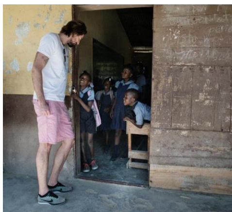
Mission UNICEF/ FFN / Camille Lacourt (parrain Nuit de l'Eau) Haïti.

« J'ai toujours été sensible à la cause des enfants. Savoir que des enfants sont malheureux ou qu'ils ne sont pas en bonne santé, c'est une grande tristesse. J'ai eu la chance de vivre beaucoup de bonheurs et j'ai envie de rendre cette chance. Je suis conscient que c'est important de prendre du temps pour ceux qui en ont besoin. L'UNICEF m'a appelé en 2013 et cela m'a permis de m'engager auprès d'une organisation internationale. »