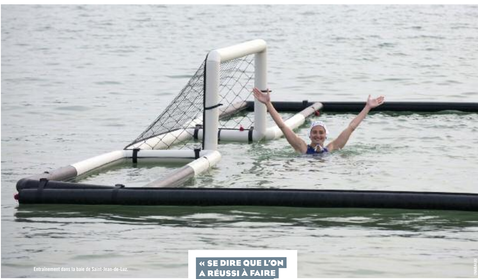
Entraînement dans la baie de Saint-Jean-de-Luz.